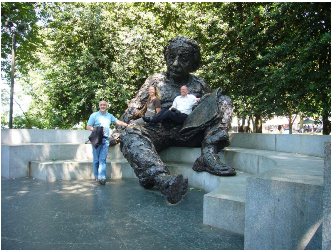
En kæmpe Einstein til at klatre på