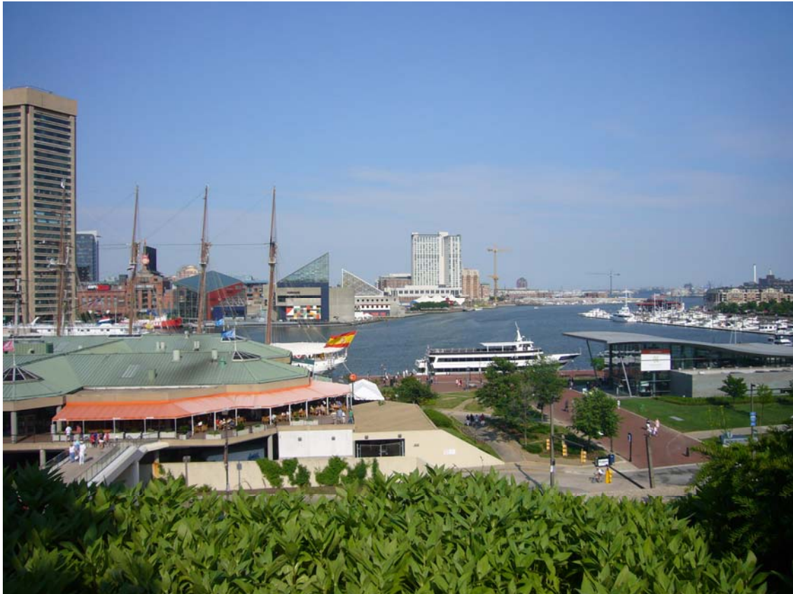
Udsigt far poolen på vores hotel