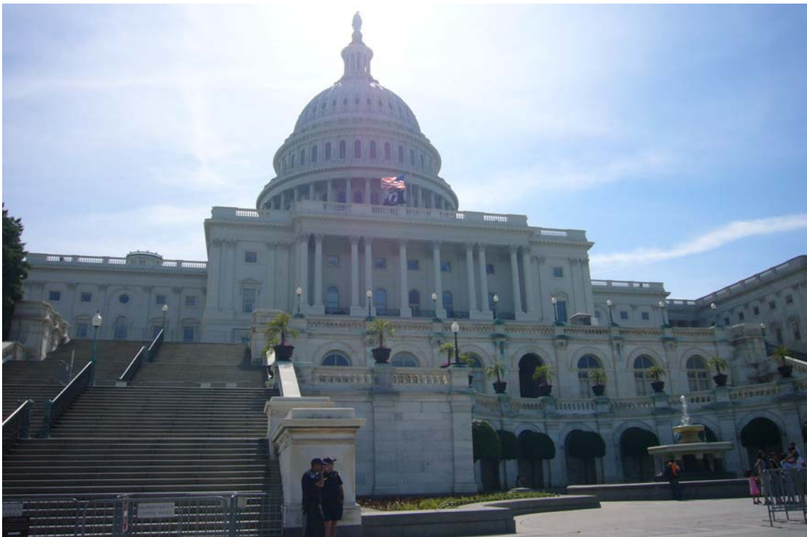
Capitol bygningen med det sorte Vietnam flag hejst sammen med stars and stripes – begge var på halv.

Bussen kørte omkring en shopping mall, hvor de der ønskede kunne handle – og derefter selv finde hjem.