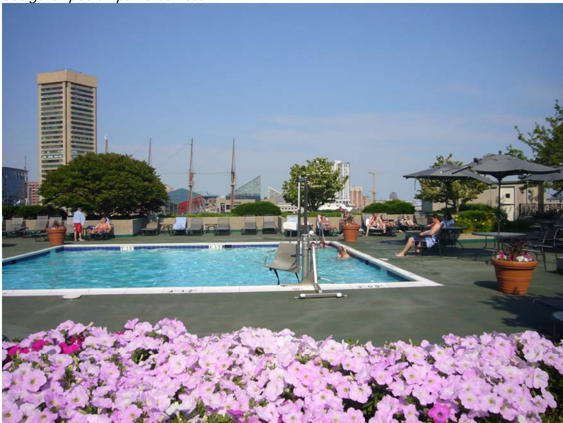
Poolen på vores hotel