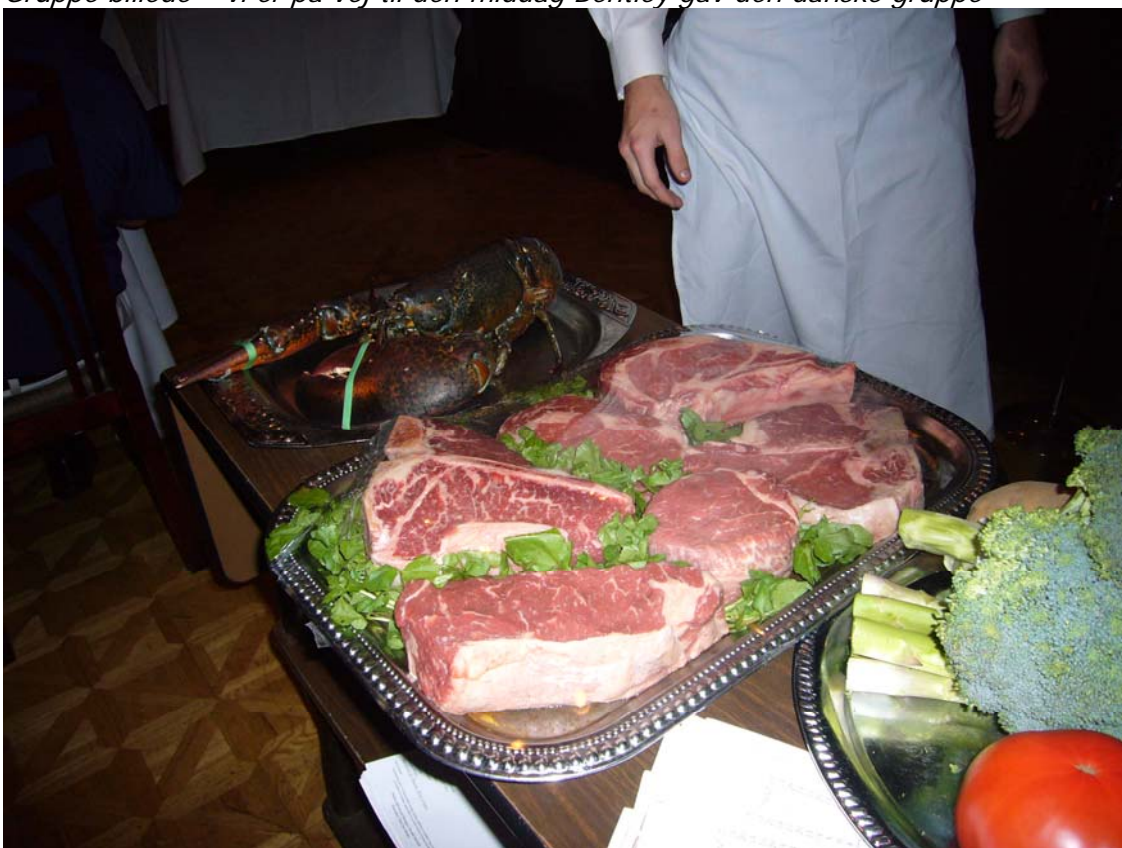
Eksempler på udvalget – imponerende