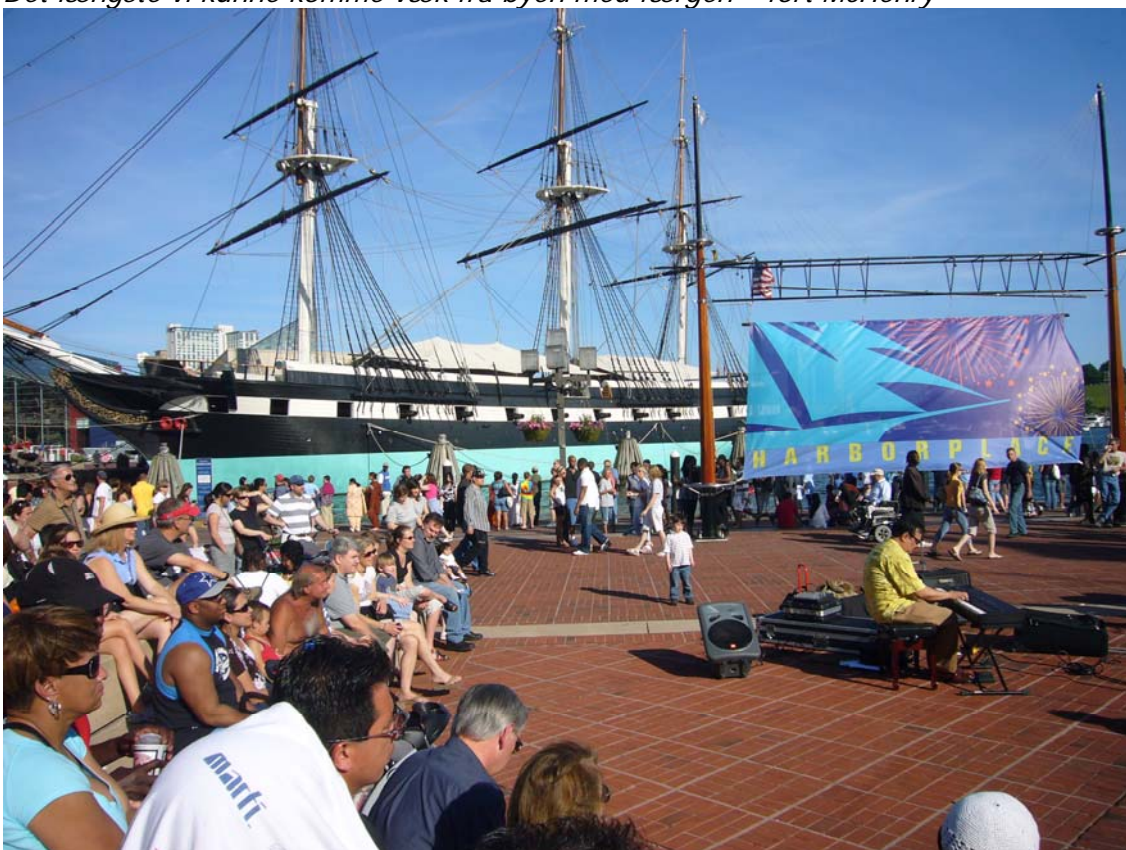
Der var gade show – her er det jazze