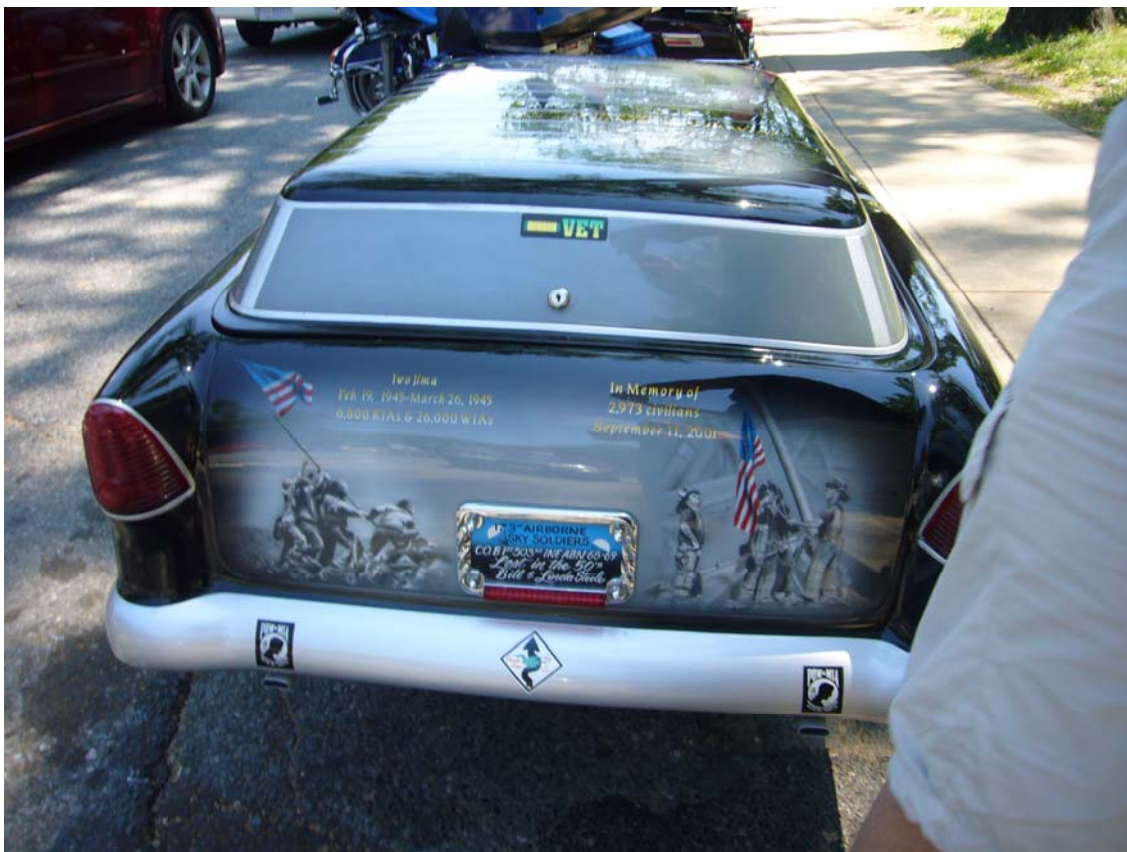
Læg mærke til den flotte lakering.