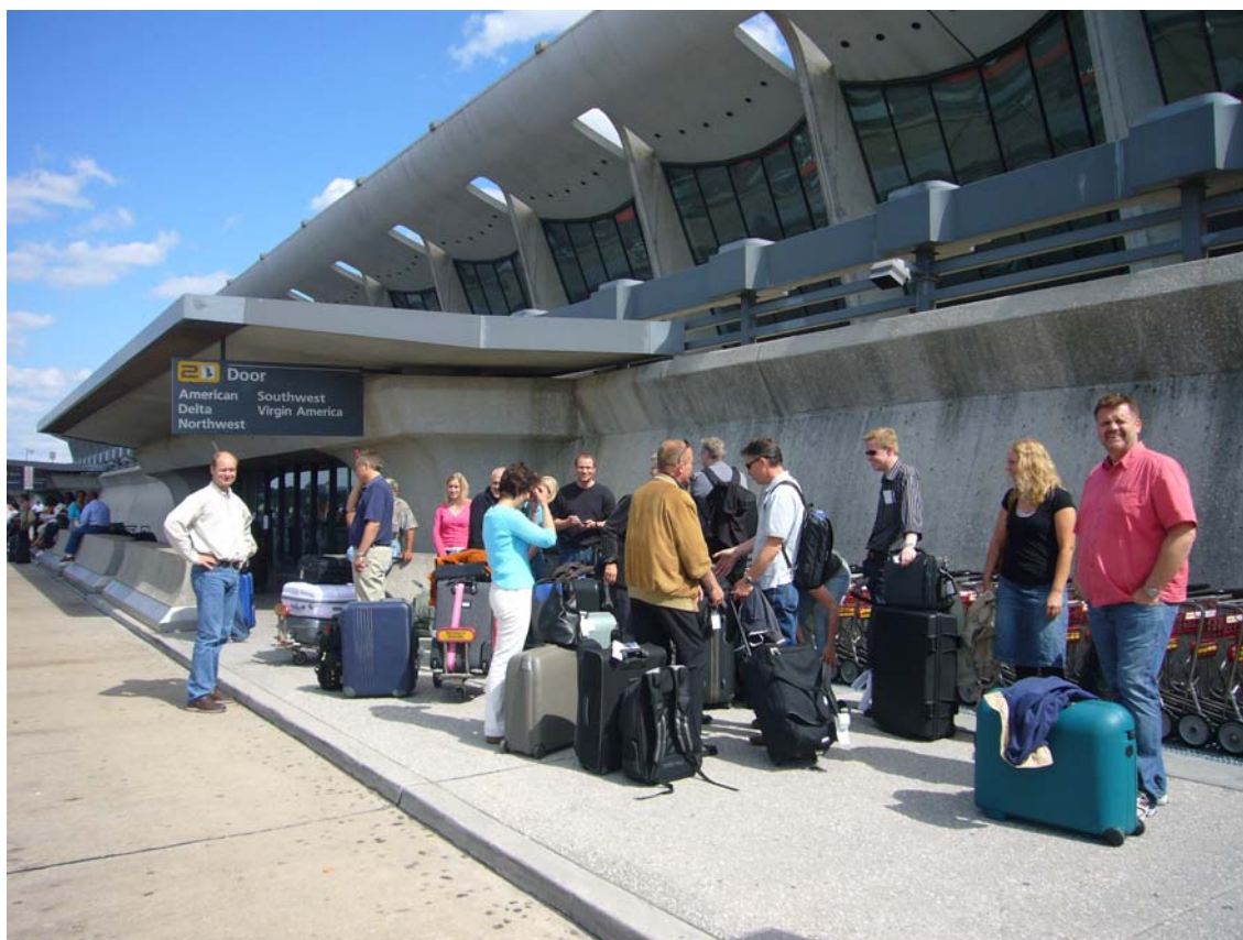
Vi venter på bussen i Washington

Der var bestilt værelser til os på hotel Hyatt meget tæt på conferencecentret. Foreningen var vært ved en fælles middag på det nærliggende Hooters, for dem der skulle ønske at vide mere om Hooters se www.hooters.com . Maden er ok, og det er faktisk en restaurant hvor hele familien USA kommer.