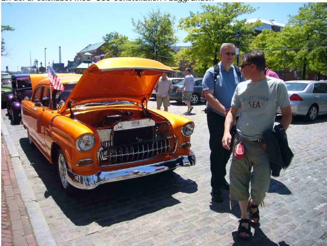
Det var svært for drengene at løsrive sig fra de flotte gamle biler