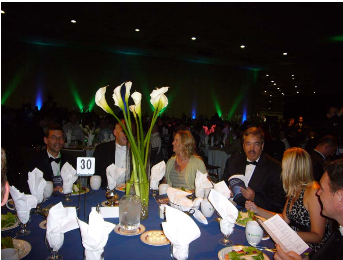
Grøntmij | Carl Bro, i festtøj