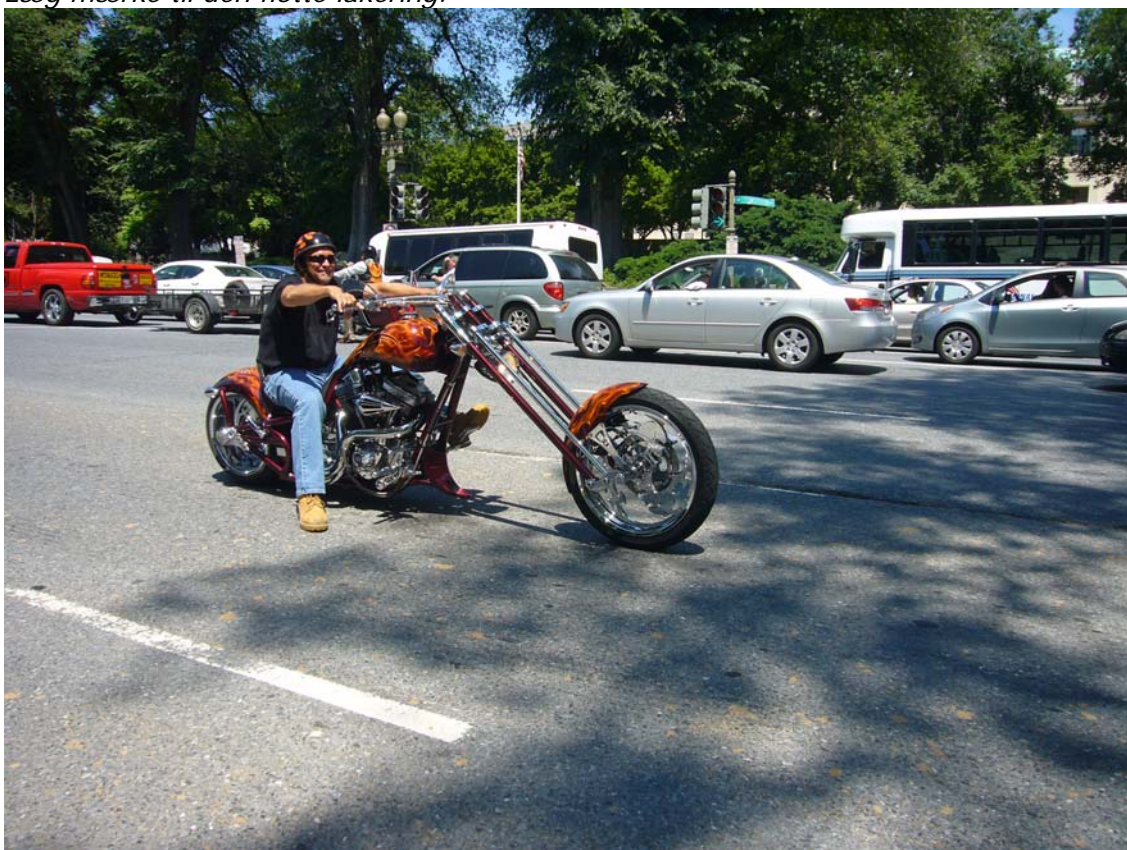
Endnu en flot motorcykel – hjelm og tank passer sammen.