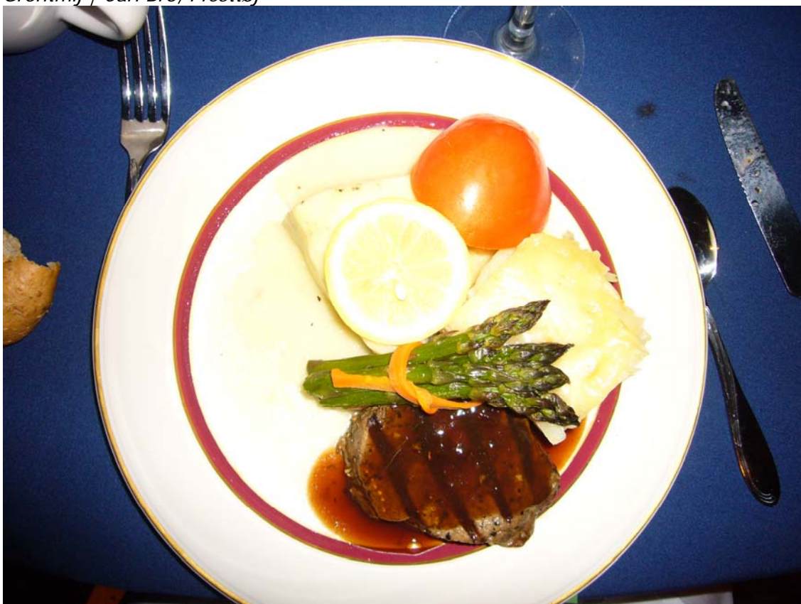
Fisk og kød på samme tallerken, sært. Det andet lyse er kartoffel