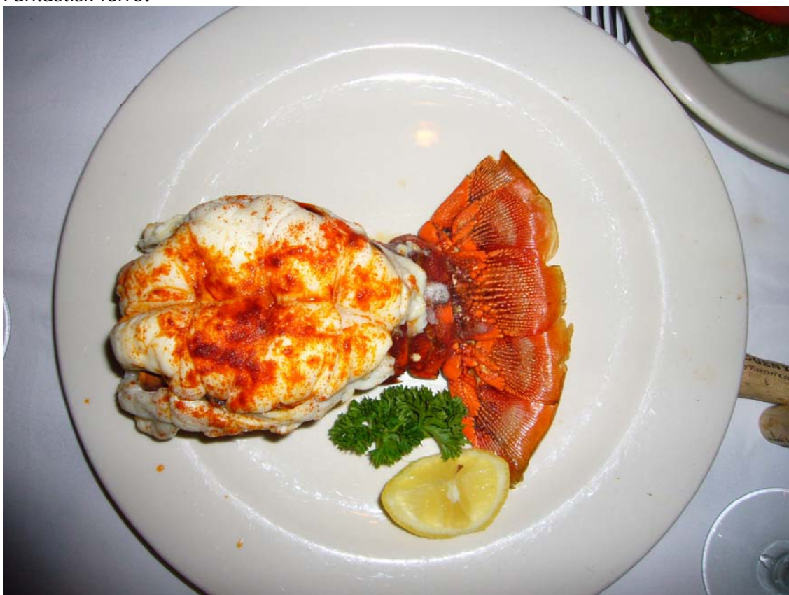
En anden fantastisk forret