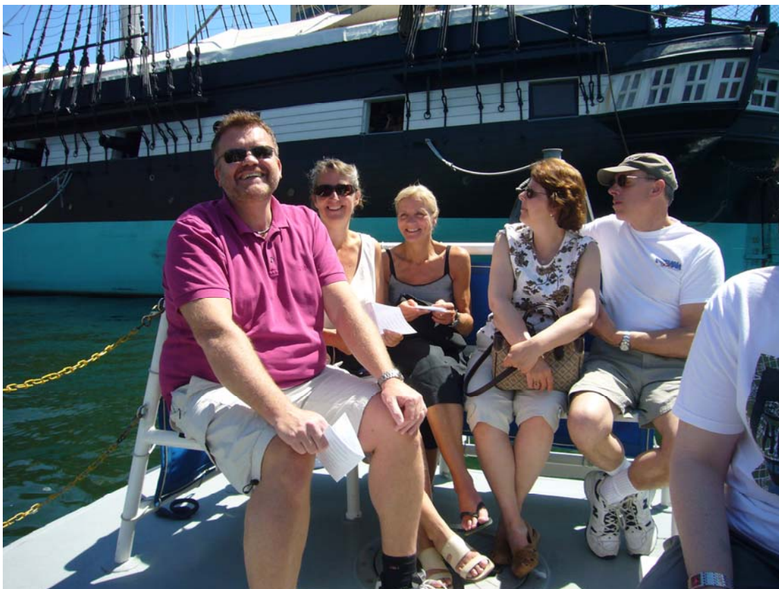
En del af selskabet med USS Constellation i baggrunden