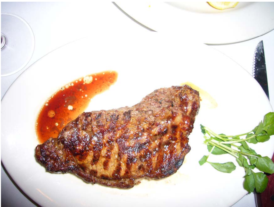
Bøf til en voksen mand – bemærk tilbehøret