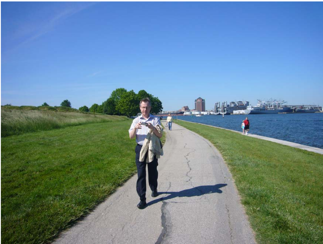
Det længste vi kunne komme væk fra byen med færgen – fort McHenry