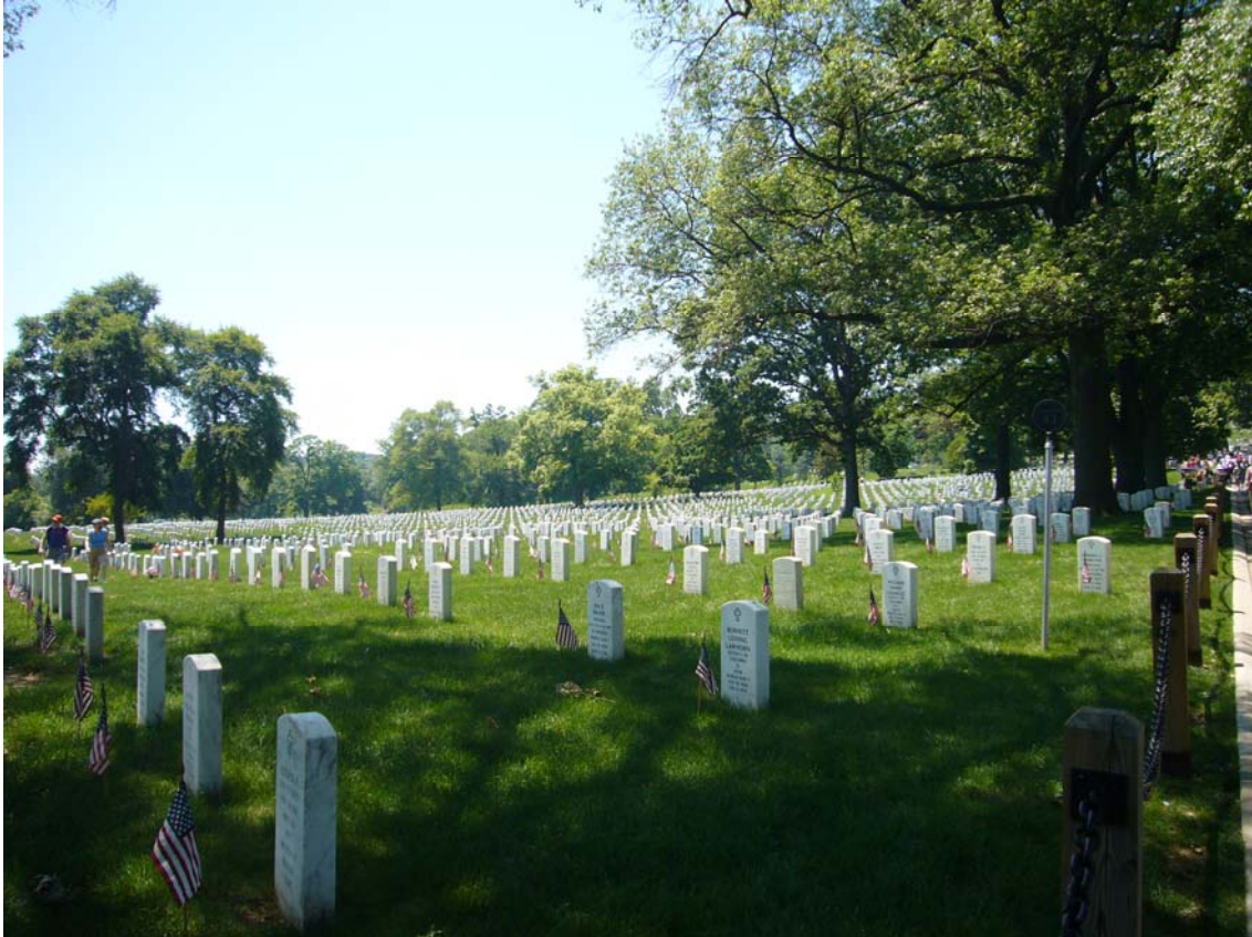
Grave på Arlington, der var sat flag ved alle grave.