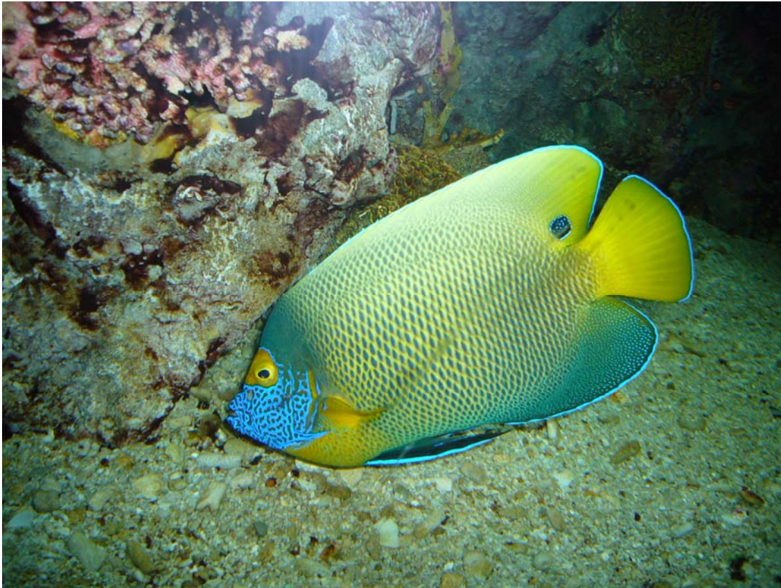
En af de flotte fisk

Baltimore har en dejlig Inner Harbor, her sejler små "bus" færger, jeg købte en billet der gjaldt hele dagen.