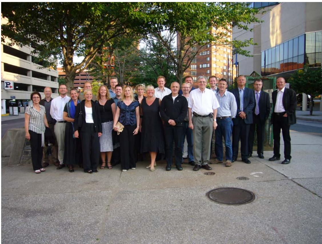
Gruppe billede – vi er på vej til den middag Bentley gav den danske gruppe