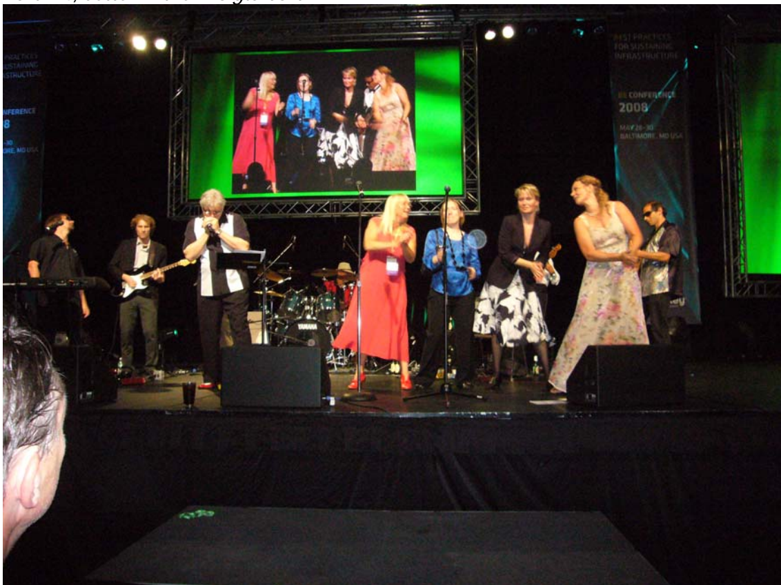
Måske er det blevet en tradition! – her med 3 danske korpiger og en svensker.