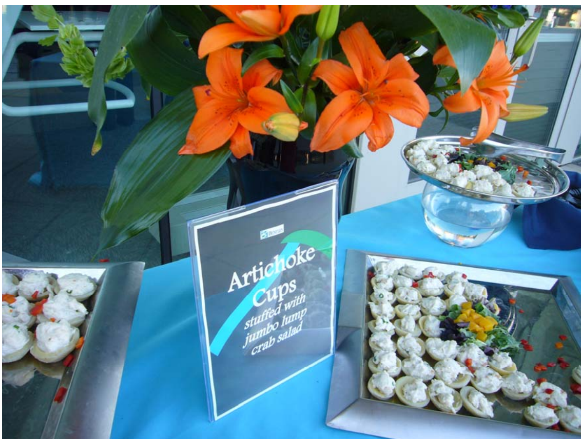
Artiskok med krabbesalat

Torsdag aften er der en Award dinner, her bliver uddelt præmier i diverse kategorier. Vejdirektoratet var nomineret i 2 kategorier – "Communicating Through Visualization" og "Innovation in Road and Bridge", derfor var jeg inviteret til den "fine" Pre-Ceremony Reception. Det foregik på taget af konvention centeret, der var sushi, artiskok, rejer mm. samt diverse drikkevarer, der var et orkester der spillede og vi var alle klædt pænt på ☺