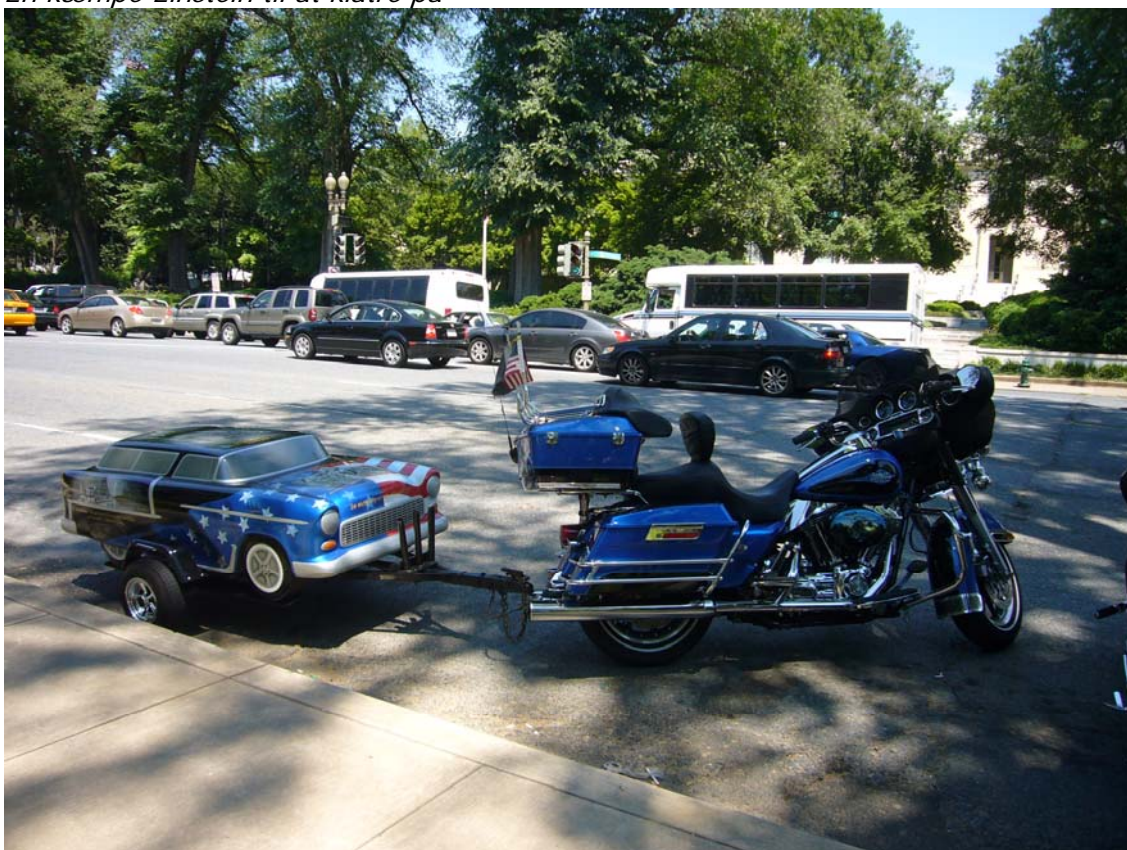
En af de flotte motorcykler med hænger!