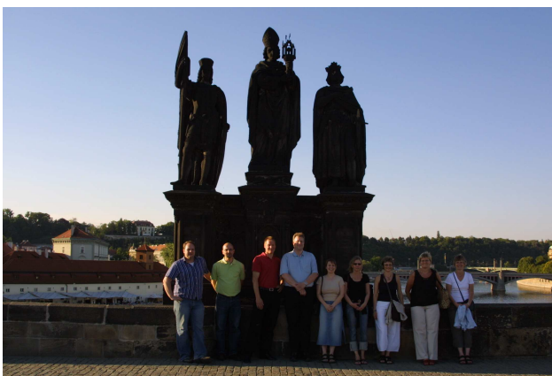
3 helgener og 9 danskere på Karlsbroen

Onsdag aften var Bentley Danmark vært for alle de danske deltagere ved en middag på en meget fin restaurant ved floden Vltava med udsigt til Karlsbroen.