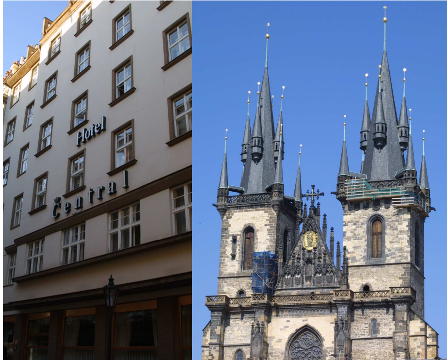
Hotel Central, som lå tæt på Tyn-kirken

Vi tog af sted lørdag den 10. juni, og ankom efter kun godt en times flyvning og en bustur med en veloplagt buschauffør, som udpegede byens seværdigheder for os, til hotel Central i Prag. Hotellet levede godt op til sit navn, da det ligger midt i Prags gamle bydel med 15 minutters gang til konferencehotellet.