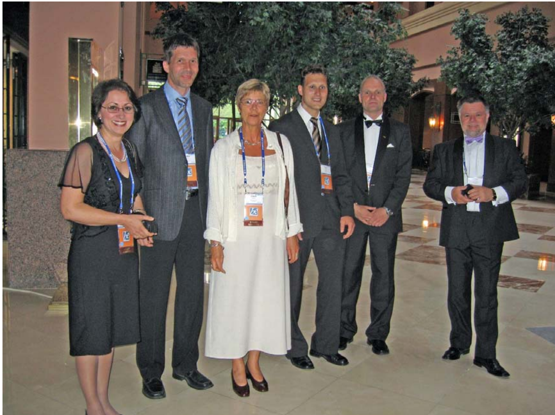
De danske nominerede

Æresgæsterne, de nominerede, ankom senere og fik lejlighed til at sidde til højbords.