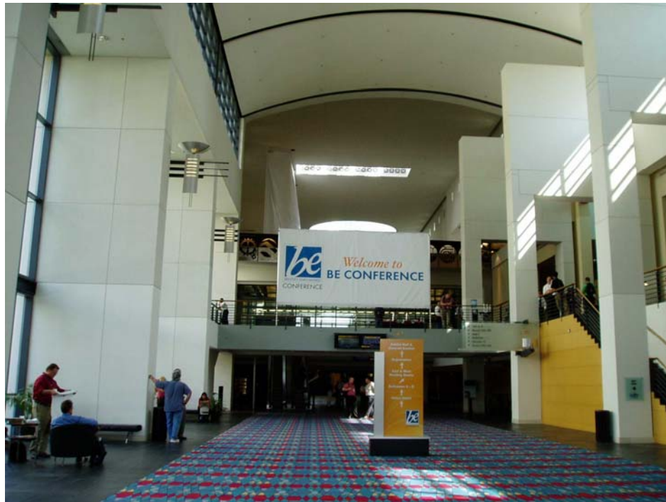
Charlotte Convention Center