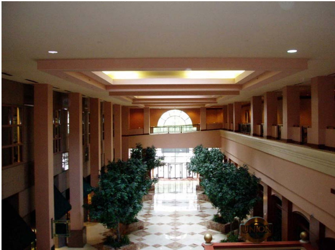
Hilton Center City Charlotte

Vores oprindelige hotel havde kort forinden afrejse kontaktet bestyrelsesformanden med beskeden om overbookning. Med gode kontacters hjælp lykkedes det, at få os ind på Hilton Center City, hvilket var lige overfor Charlotte Convention Center.